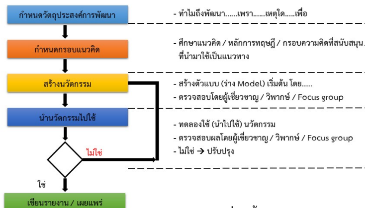
ภาพที่ 1 ขั้นตอนในการพัฒนานวัตกรรม