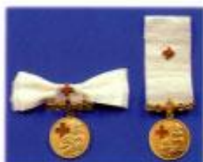
เหรียญทาชาดสมนาคุณขั้นที่ 1 (เบรชทาโรคา 100 ครั้ง)

(หมู่บชชานดัดดิงพระทินุขธิดาทศโรคาตั้งแต่ 8,000 ชุดขึ้นไป และบชชชิตดชานเบรชทาโรคาตั้งแต่ 8 ปี)