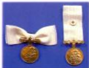
เหรียญทาชาดสมนาคุณขั้นที่ 2 (เบรชทาโรคา 75 ครั้ง)

(หมู่บชชานดัดดิงพระทินุขธิดาทศโรคาตั้งแต่ 8,000 ชุดขึ้นไป และบชชชิตดชานเบรชทาโรคาตั้งแต่ 8 ปี)