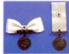
เหรียญทาชาดสมนาคุณขั้นที่ 3 (เบรชทาโรคา 50 ครั้ง)

(หมู่บชชานดัดดิงพระทินุขธิดาทศโรคาตั้งแต่ 6,000 ชุดขึ้นไป และบชชชิตดชานเบรชทาโรคาตั้งแต่ 6 ปี)