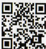
QR-Code แผ่นพับประชาสัมพันธ์