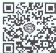
กลุ่มพลเมืองดี ปี๖๕

สำนักงานปลัดกระทรวง สำนักตรวจราชการและเรื่องราวร้องทุกข์ โทร. ๐ ๒๒๒๑ ๑๑๓๓ มท ๕๐๙๒๐ โทรสาร ๐ ๒๒๒๒ ๖๘๓๘