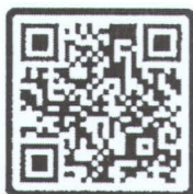
อ้างถึงและสิ่งที่ส่งมาด้วย